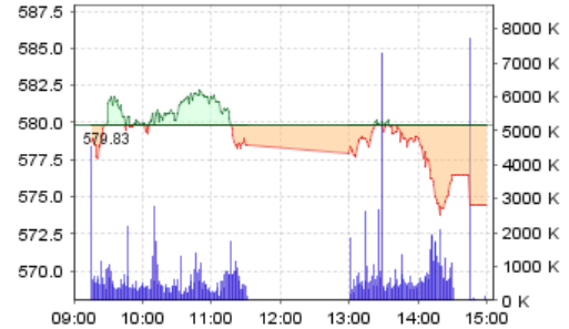
VN-Index: Kết quả giao dịch