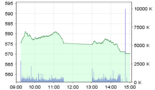
VN-Index: Kết quả giao dịch