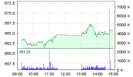
VN-Index: Kết quả giao dịch