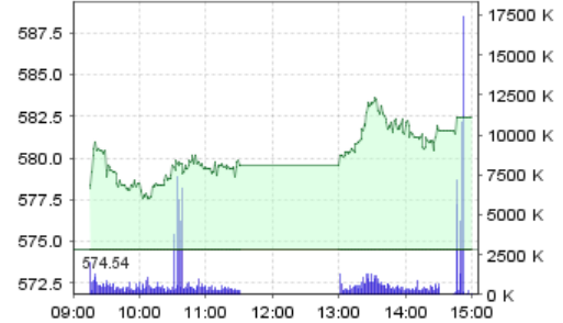
VN-Index: Kết quả giao dịch