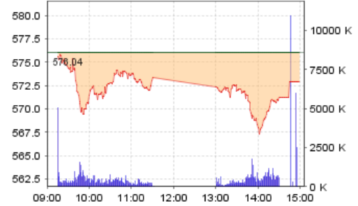
VN-Index: Kết quả giao dịch

Dù áp lực bán tháo đã giảm đáng kể trong hôm nay, chúng tôi cảm thấy vẫn còn nhiều lý do để thận trọng với thị trường trong ngắn hạn. Các vùng hỗ trợ ngắn hạn của VN-Index và HNX-Index đang bị thử thách và còn quá sớm để khẳng định những khu vực này được bảo vệ thành công. Chúng tôi bảo lưu quan điểm giữ tỷ trọng cân bằng giữa tiền và cổ phiếu trong danh mục cho giai đoạn hiện nay.