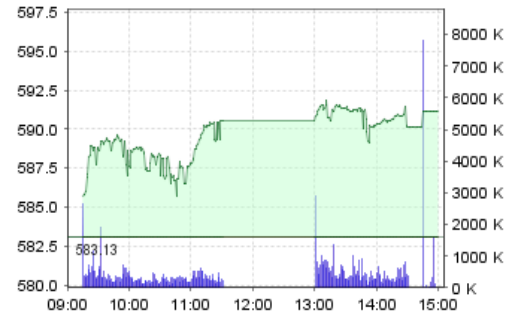
VN-Index: Kết quả giao dịch