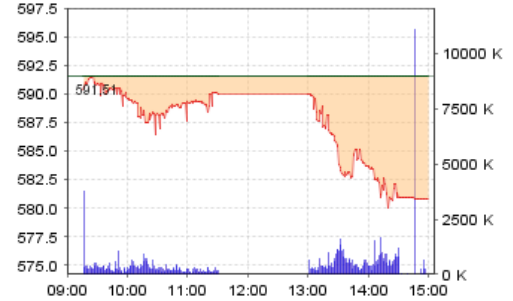
VN-Index: Kết quả giao dịch