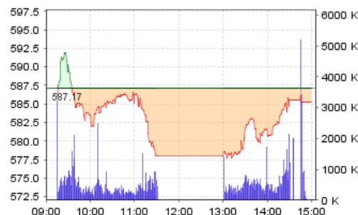
VN-Index: Kết quả giao dịch