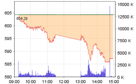
VN-Index: Kết quả giao dịch