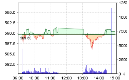
VN-Index: Kết quả giao dịch